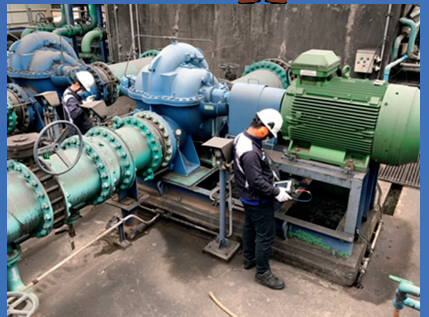
ตัวอย่างรูป งานวิเคราะห์และตรวจติดตามสภาพเครื่องจักรโดยเทคโนโลยีวิเคราะห์ความสั่นสะเทือน