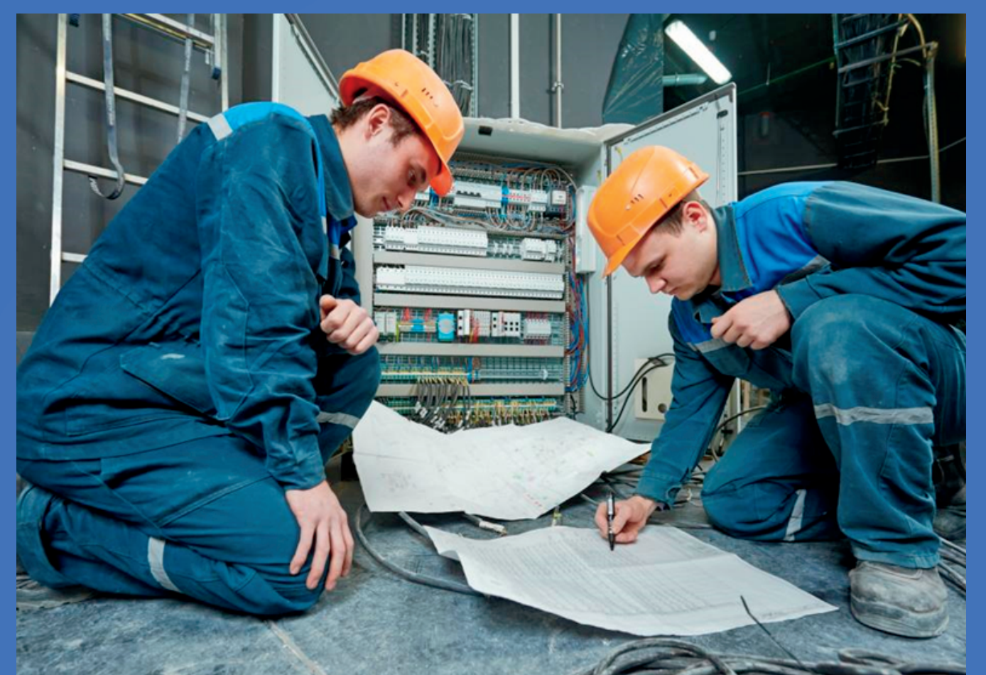
งานวิเคราะห์ความเสียหายของอุปกรณ์หลังเกิดเหตุ